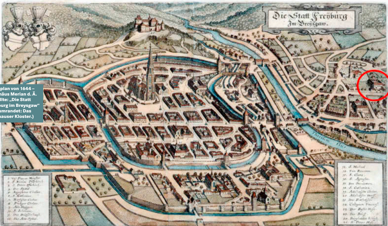
Stadtplan von 1644 – Matthäus Merian d. Ä. erstellte: „Die Stadt Freyburg im Breysgau“ (Rot umrandet: Das Adelhauser Kloster.)