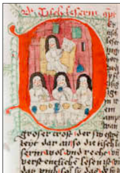
Bildung im Kloster: Tischleserin liest für die Nonnen beim Essen.